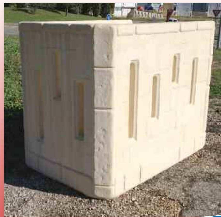
(Réf. MU ACPL2) GEM