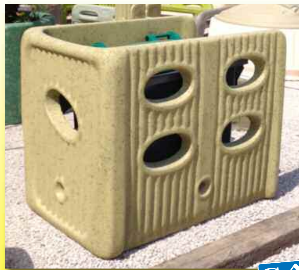
(Réf. MU ACPL1) NOT