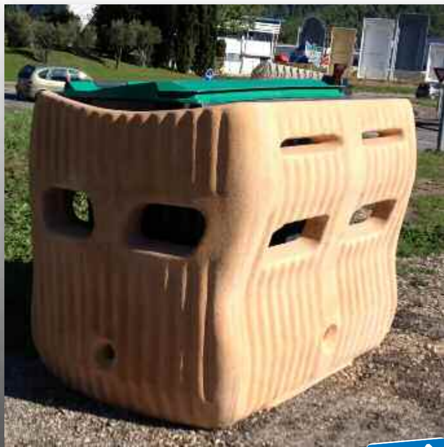
(Réf. MU ACPL) LECO