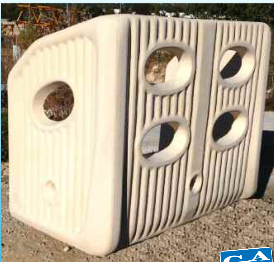
(Réf. MU ACPF1) NOT